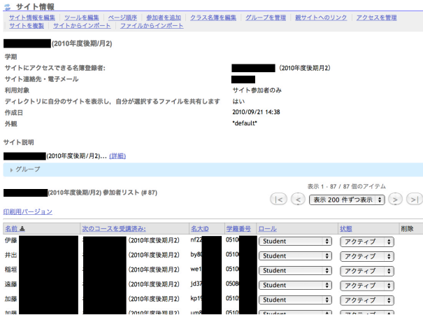
図4 学籍番号表示機能の追加後画面