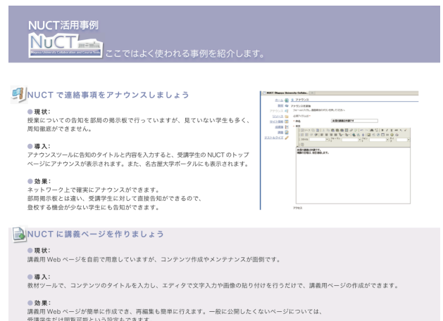
図6 NUCT活用事例集(抜粋)

2011年度に講義・研修を担当する教員に対して、NUCT利用講習会を実施した。講習会の内容としては、授業コースサイト内に配置されたツールを実際に操作してもらうことで各ツールの機能を理解し、教材作成、配布、テストの実施などが一通りできるようになってもらうための基本的な内容で実施された。また、新規利用者に対して、「NUCTで何ができるのか」、「どのツールをどのように使用すればよいのか」を示した、事例集を作成した(図6参照)。この事例集は印刷した上で全教員に対して配布する予定である。