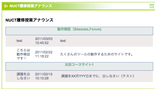
図5 NUCT履修授業アナウンスチャンネル (名古屋大学ポータル内)

利用者の利便性を考慮し、情報連携統括本部において運用されている名古屋大学ポータルとの連携を図った。具体的には、NUCTの各授業コースサイトにおいて、アナウンスツールを用いて登録されたアナウンスを「名古屋大学ポータル」上で表示するポートレットチャンネルを作成した(図5参照)。